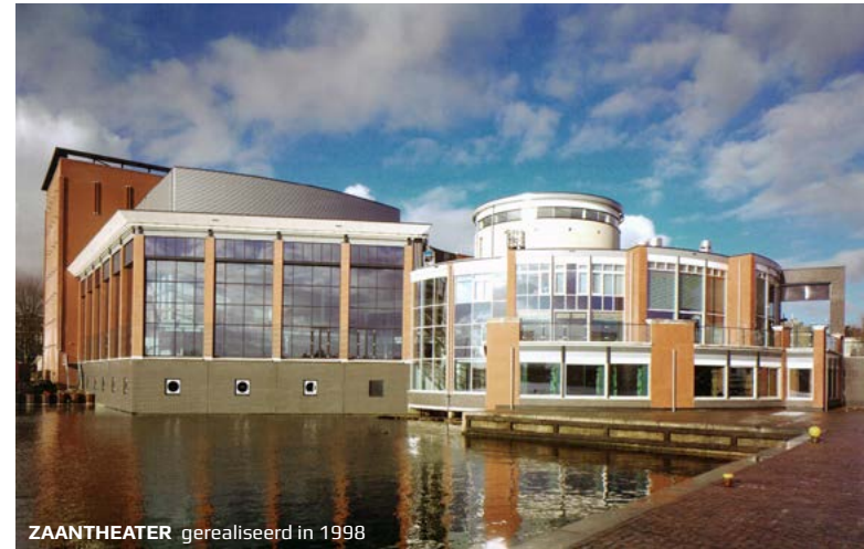
ZAANTHEATER gerealiseerd in 1998